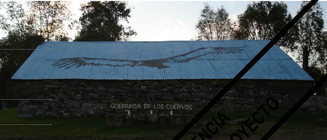
FACHADA SURESTE ESC: 1:75