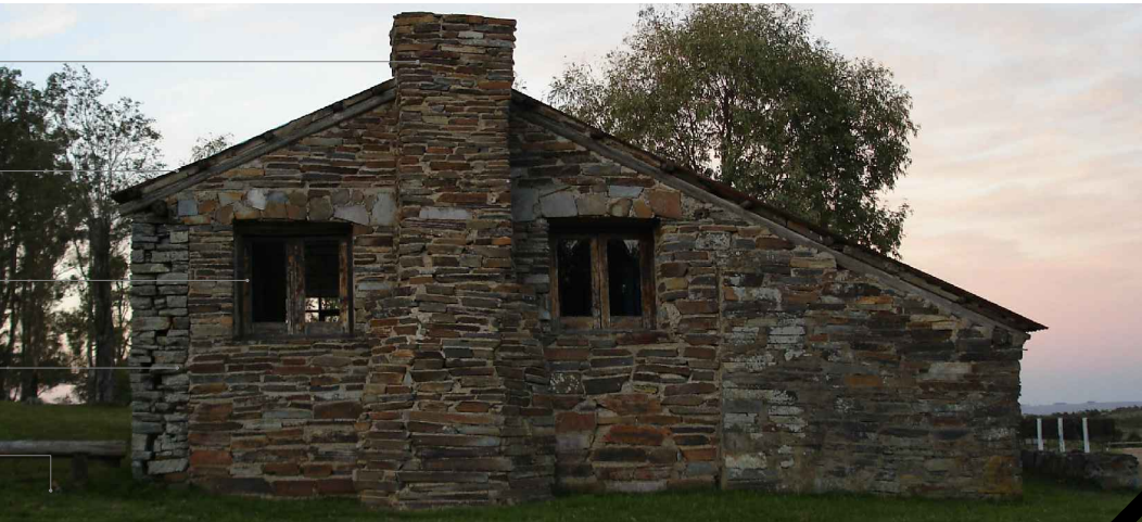
FACHADA SUROESTE ESC: 1:75