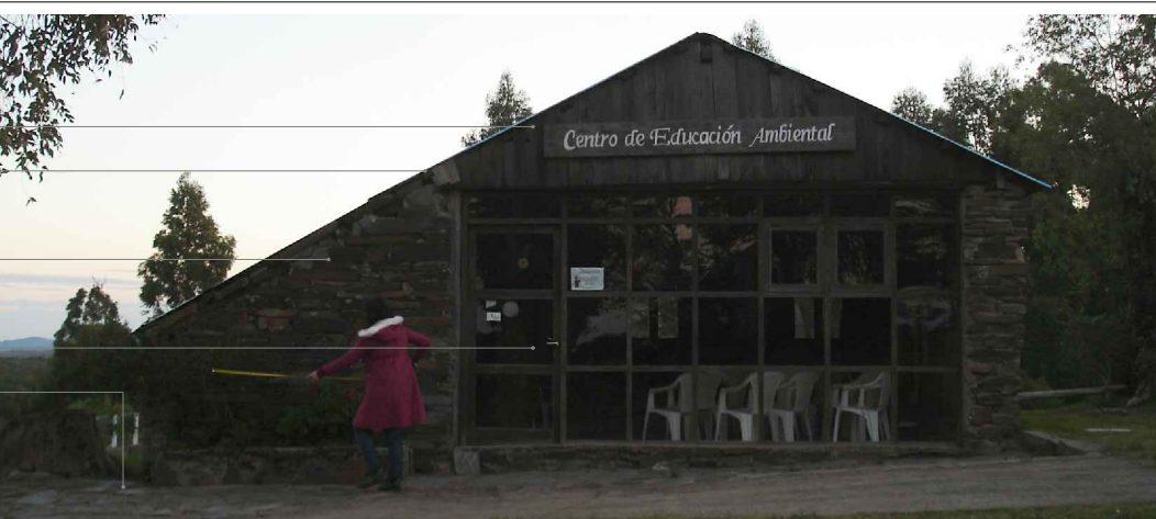
FACHADA NORESTE ESC: 1:75